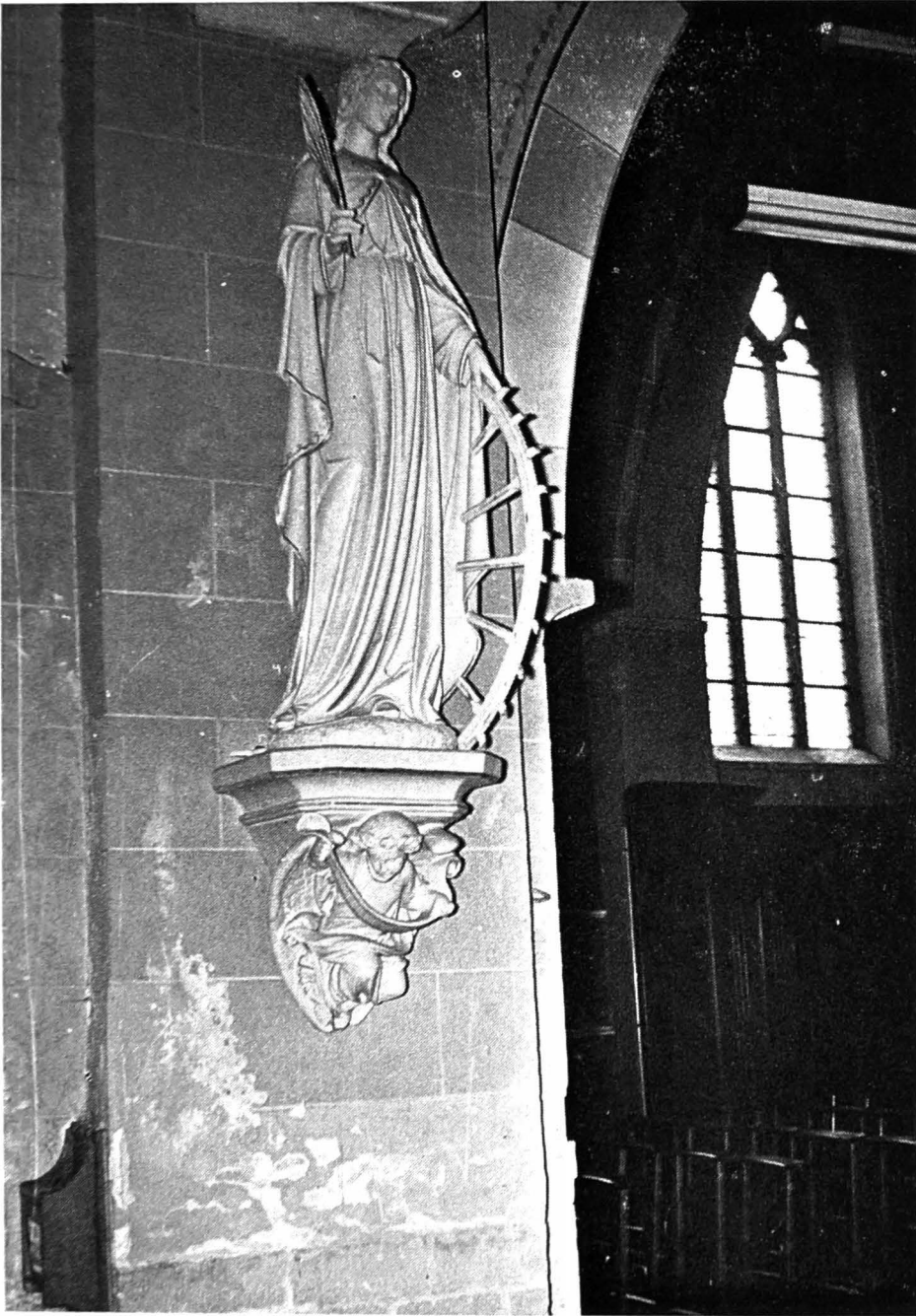
Het beeld van de H. Catharina tegenover de predikstoel.