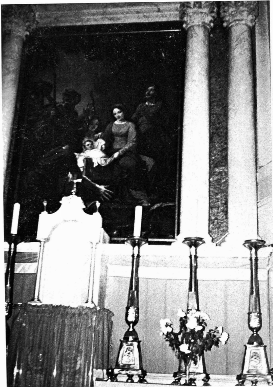
Het schilderij van J. Paelinck boven het hoofdaltaar in de parochiekerk te Wachtebeke.