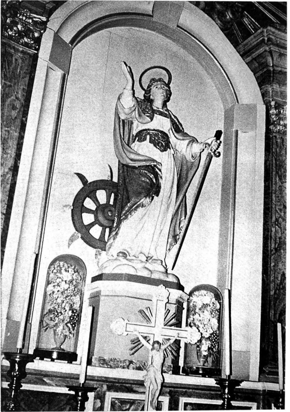
Het beeld van de H. Catharina in de doopkapel.